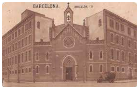
Asilo de niños, calle Muntaner

La obra se realizó en una casa céntrica de la ciudad en la calle Muntaner a la altura de la calle Rosellón (lo que hoy es el Colegio de San Miguel), alquilada por 50 pesetas al mes. Disponía sólo de 12 camas, figurando entre sus finalidades, según consta en el Reglamento fundacional: “el cuidado de los niños varones de cinco a doce años; niños escrofulosos y raquíticos. También se ocuparán de su educación e instrucción” . El equipamiento y el personal de enfermería, lógicamente, en los comienzos fue escaso, pero lo importante, para el Padre Menni, era empezar, ofreciendo un signo palpable de la presencia del espíritu de San Juan de Dios, al